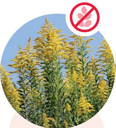
Nordamerikanische Goldruten Solidago canadensis und gigantea

Herkunft: Ostasien Blütezeit: Juli bis September