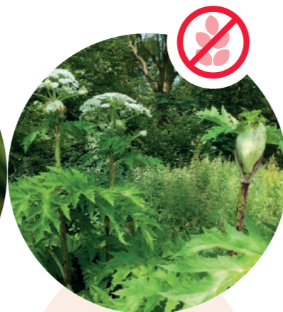
Riesenbärenklau Heracleum mantegazzianum

Herkunft: Himalaja Blütezeit: Juli bis September