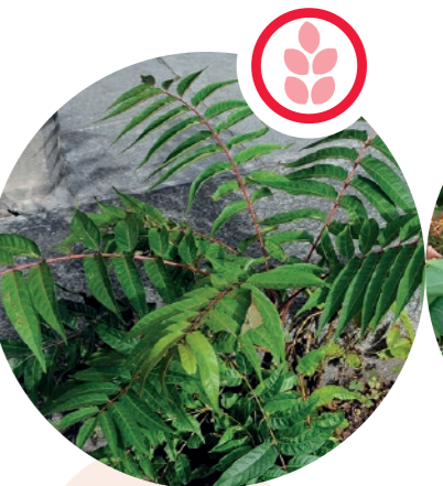
Götterbaum Ailanthus altissima

Herkunft: Nordamerika Blütezeit: Mai bis Juni