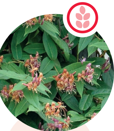
Asiatische Geissblätter Lonicer henryi und japonica

Herkunft: China Blütezeit: Juni bis Juli