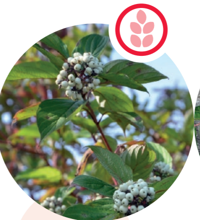
Seidiger Hornstrauch Cornus sericea

Herkunft: Südwestasien Blütezeit: April bis Mai