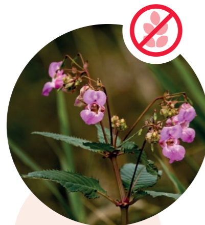
Drüsiges Springkraut Impatiens glandulifera