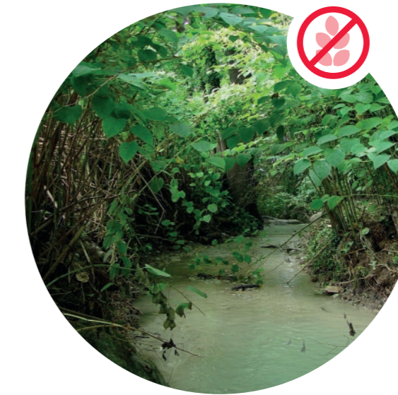
Asiatischer Staudenknöterich verdrängt Vegetation am Bach.

Helfen Sie mit und entfernen Sie exotische Problempflanzen aus Ihrem Garten, damit sich diese nicht unkontrolliert in die Nachbarschaft und in natürliche Lebensräume ausbreiten.