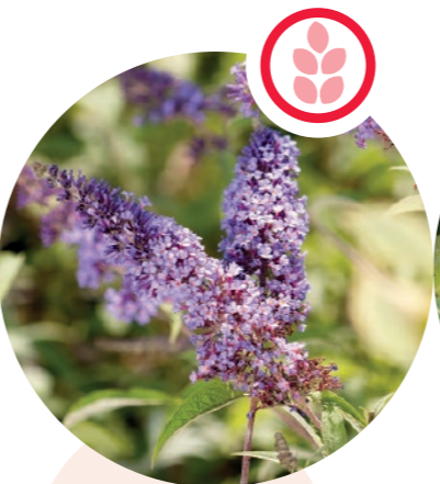
Sommerflieder Buddleja davidii

Herkunft: Nordamerika Blütezeit: Juli bis Oktober