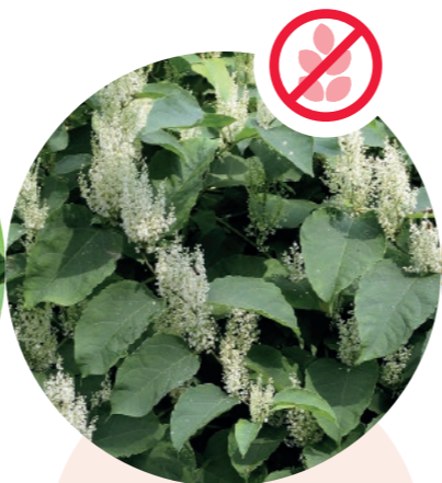
Asiatische Staudenknöteriche Reynoutria japonica, R. sachalinensis etc.

Herkunft: Nordamerika Blütezeit: Mai bis Juni