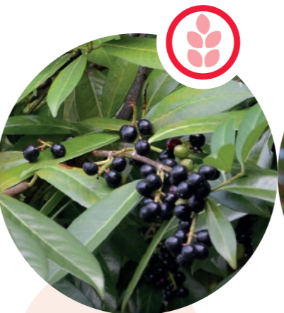
Kirschlorbeer Prunus laurocerasus

Herkunft: China Blütezeit: Juli bis August