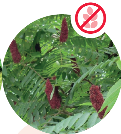
Essigbaum Rhus typhina

Herkunft: Kaukasus Blütezeit: Juli bis September